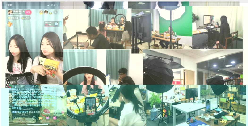
部份学员正在进行电商直播实训现场